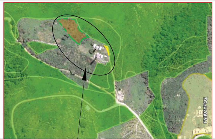
ΑΠΟΣΠΑΣΜΑ ΜΕΡΙΚΟΣ ΚΥΡΩΜΕΝΟΥ ΔΑΣΙΚΟΥ ΧΑΡΤΗ Π.Ε. ΚΕΡΚΥΡΑΣ

Το παρόν ανήκει στη με αριθμό 27388/23-1-2025 απόφαση Γ.Υ. Δασίων ΥΠΕΝ